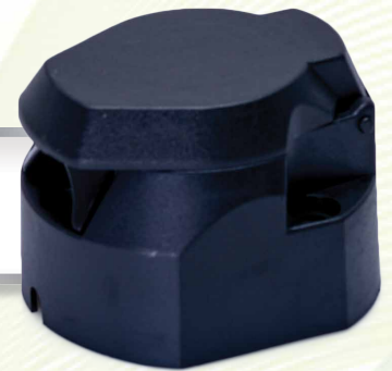
Gniazdo elektryczne przyczepy 7-biegunowe 12V/N

SYMBOL: IPRT-EL-B1 standard 10 szt. IPRT-EL-B2 mini 10 szt.