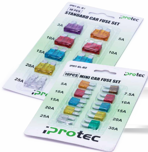
Bezpieczniki płytkowe płaskie

SYMBOL: IPRT-EL-120A 120A, dł. 2.5 m IPRT-EL-200A 200A, dł. 2.5 m IPRT-EL-400A 400A, dł. 2.5 m