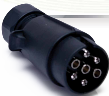
Wtyczka wiązki haka 7-biegunowa