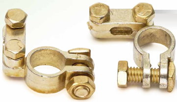
Ocynkowane klemy do akumulatorów