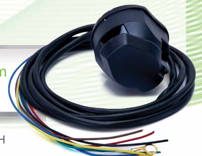
Wiązka elektryczna haka dł. 1300 mm z 7-pinowym gniazdem

SYMBOL: IPRT-EL-KH4 kostka żarówki H4 IPRT-EL-KH7 kostka żarówki H7